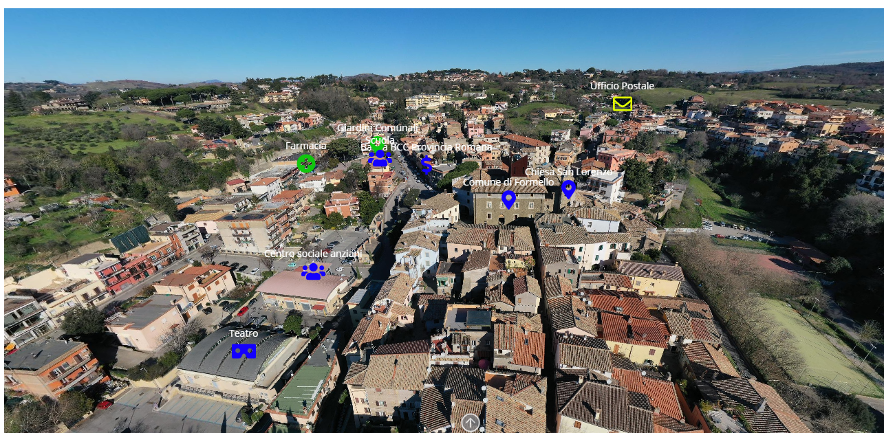
Immagine di esempio della piattaforma

Il progetto prevede la realizzazione di una piattaforma web accessibile da qualsiasi device collegato ad internet che permetterà, grazie ad una visione aerea navigabile di tutto il territorio di Formello attraverso “hotspot” bilingue (italiano ed inglese), di individuare luoghi ed edifici e reperire visivamente ed immediatamente informazioni su servizi, turismo, attività economiche e commerciali oltre agli esercizi per la ristorazione e l'accoglienza quali hotels, bed & breakfast o agriturismi ed ogni altra risorsa utile alla fruizione del territorio da parte della cittadinanza e dei turisti. Gli “hotspot” previsti sono oltre settanta, con la possibilità di ampliare le categorie da inserire fino a raggiungere la totalità delle indicazioni previste.