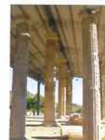
Scavi Archeologici "CUMA"

e-mail: com.monterinaldo@provincia.fm.it pec: comune.monterinaldo@emarche.it