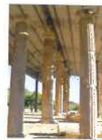
Scaui Archeologici "E.L.M.A."

e-mail: com.monterinaldo@provincia.fm.it pec: comune.monterinaldo@emarche.it