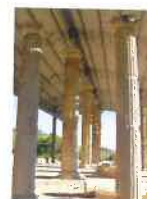
Scavi Archeologici "CULMA"

e-mail: com.monterinaldo@provincia.fm.it pec: comune.monterinaldo@emarche.it