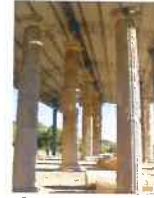
Scavi Archeologici "CUMA"

e-mail: com.monterinaldo@provincia.fm.it pec: comune.monterinaldo@emarche.it