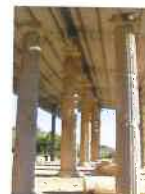
Scavi Archeologici "CUMA"

2. Il plico contenente quanto indicato all'art. 8 del presente bando dovrà essere sigillato e dovrà riportare la seguente dicitura "Contributo a sostegno delle nuove attività in centro storico".