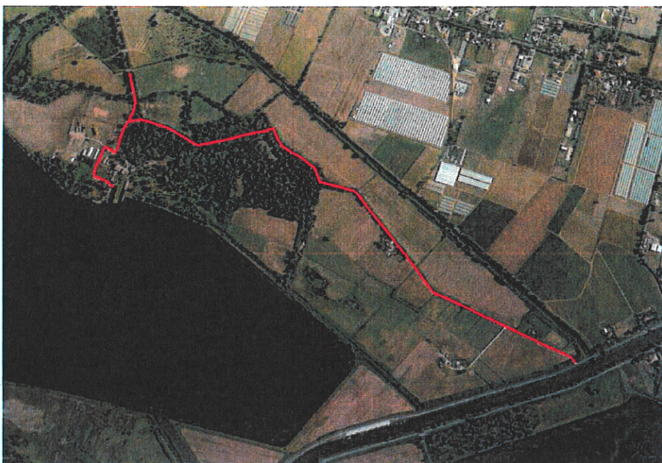
Area Borgo Fogliano.