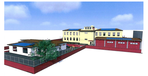
POLO SCOLASTICO Vista Posteriore