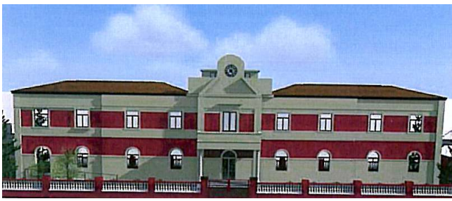
EDIFICIO "G. FALCONE" VISTA FRONTALE