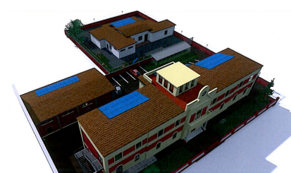
POLO SCOLASTICO Vista aerea