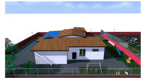
SCUOLA DELL'INFANZIA "M. MONTESSORI" Vista laterale