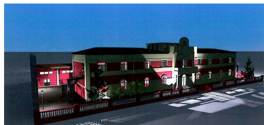
EDIFICIO "G. FALCONE" VISTA LATERALE NOTTURNA