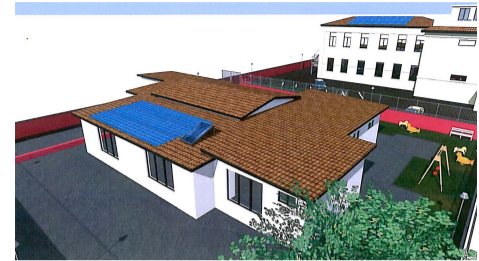
SCUOLA DELL'INFANZIA "M. MONTESSORI" Vista dall'alto