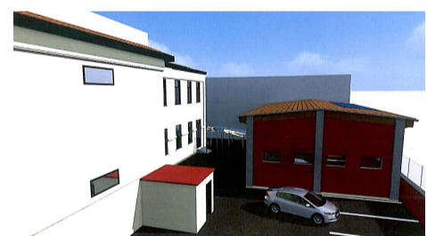
PALESTRA Vista laterale