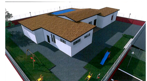
SCUOLA DELL'INFANZIA "M. MONTESSORI" Vista dall'alto