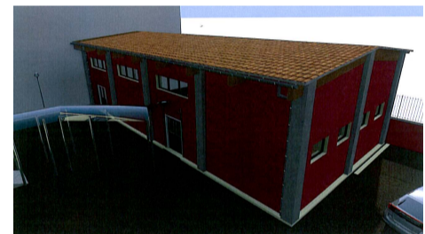
PALESTRA Vista dall'alto