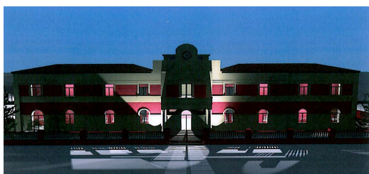
EDIFICIO "G. FALCONE" VISTA FRONTALE NOTTURNA