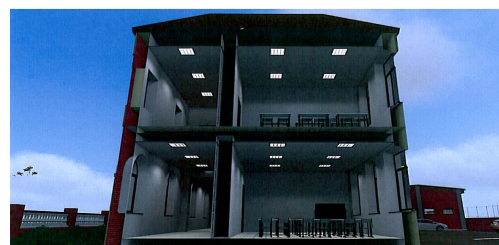
EDIFICIO "G. FALCONE" SPACCATO ASSONOMETRICO