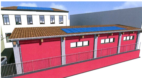
PALESTRA Vista posteriore