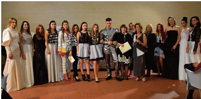
SFILATA DI MODA - Istituto Olivieri - Tivoli

ASSOCIAZIONE VILLA D'ESTE Piazza Plebiscito, 23 TIVOLI Tel. 0774 332918 329 1647661 annabenedetti40@gmail.com c/c postale 20826004 www.legarcobaleno.it